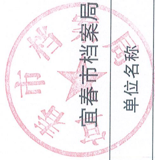
吉林市档案局2021年度行政征用实施情况统计表